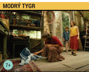
MODRÝ TYGR Česko, Německo, Slovensko | 2012 | 90 min | české znění | režie: Petr Kouropec

Středoškolák Geordie se zamiluje do dívky od vedle, kterou vídá za oknem. Záhy však zjišťuje, že on je jediný, který dívku může vidět – zemřela totiž před rokem na cystickou fibrózu, která postihuje dýchací ústrojí a nedá se vyléčit. Geordiemu chvíli trvá, než mu vůbec dochází, že se zamiloval do ducha, ale jakmile společně naváží kontakt, tajemná Max ho požádá, jestli jí nepomohl splnit seznam přání.